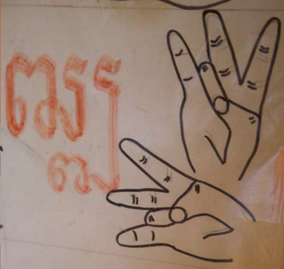
På væggene hænger adskillige hjælpemidler, som denne plakat med alfabetet.