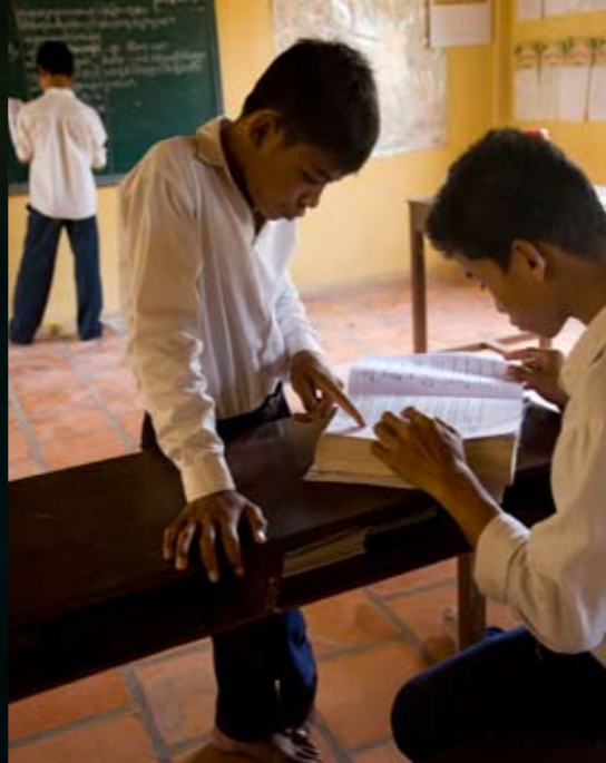
Børnene har sjældent mødt en anden døv før, nu er der et særligt sammenhold i klasserne. De elever, der klarer sig bedst, hjælper kammeraterne.