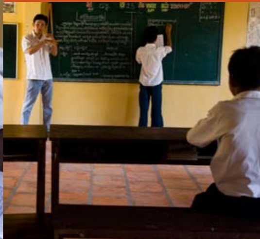
Der er seks-otte elever i hver klasse. Mange af eleverne har tidligere gået i cambodjansk folkeskole, hvor der normalt er 50-60 elever i en klasse.

I Cambodja eksisterer døvhed ikke officielt, og døvhed forveksles ofte med dumhed. Ud af hundredvis af organisationer i det fattige land i Sydøstasien er det kun to, der har fokus på problemet.