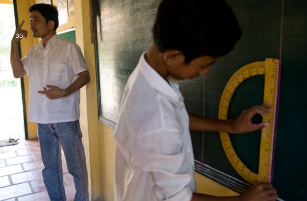
Eleverne lærer tegnsprog, men også matematik, geografi og historie. De undervises på en blanding af amerikansk tegnsprog og Khmer, men håbet er at Khmer på et tidspunkt bliver så udviklet, at der ikke er behov for andre sprog.